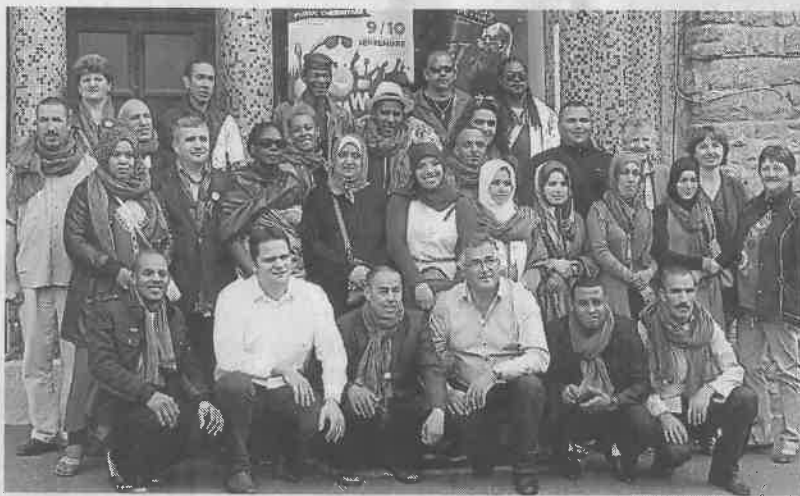
Les délégations étrangères devant le local de la Patate en fête, jeudi soir.

Jeudi soir, salle de l'Étoile, aux accents du Folklore du Lié et de ses virevoltants danseurs, les responsables de la Belle du Lié et les élus ont accueilli les délégations étrangères invitées à la Pomme de terre en fête. Le groupe folklorique gadeloupéen, Désirad'Kâ, le groupe berbère, Tizouite, les Polonais et les