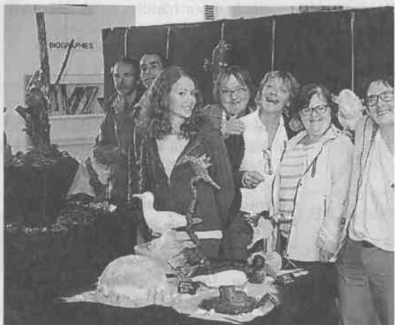
Artistes et éducateurs se sont beaucoup investis dans le

Pour son exposition de rentrée, la médiathèque municipale a choisi d'accueillir la production des adultes du Service d'accueil et de travail adapté (Satra) des Mauriers, à Saint-Quihouët. Bâtie sur le thème des oiseaux, et sur les conseils avisés de l'ornithologue Yann Le Meur, l'exposition propose des poteries, des tableaux, des dessins et autres compositions intuitives.